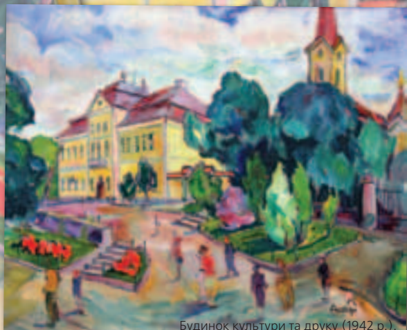
Будинок культури та друку (1942 р.). Закарпатський художній музей ім. І. Бокшая