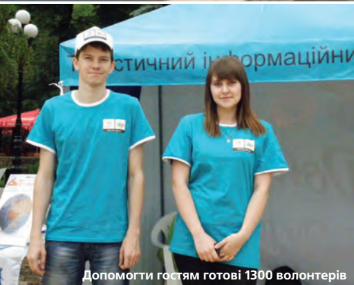
Допомогти гостям готові 1300 волонтерів