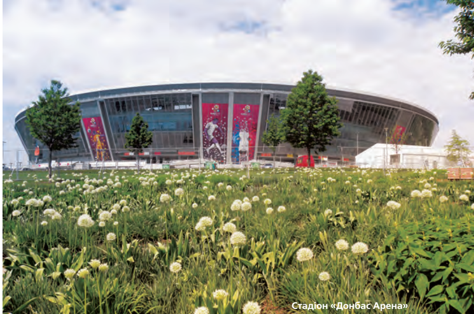
Стадіон «Донбас Арена»