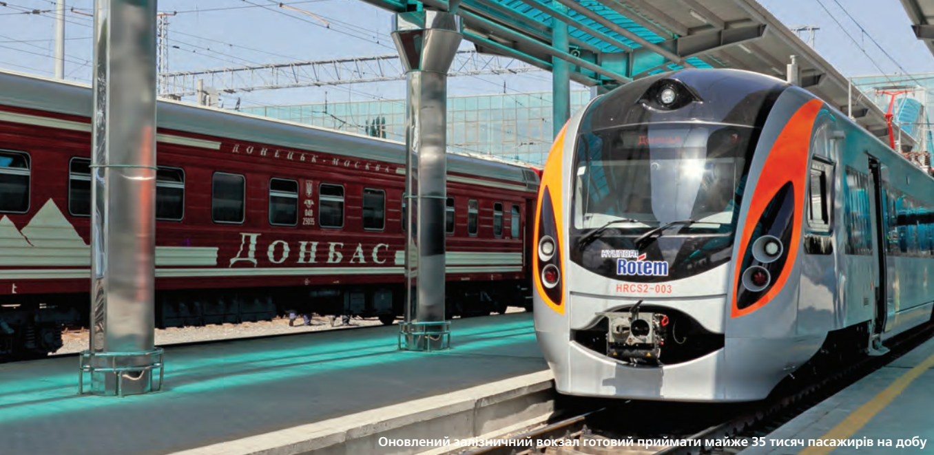
Оновлений залізничний вокзал готовий приймати майже 35 тисяч пасажирів на добу