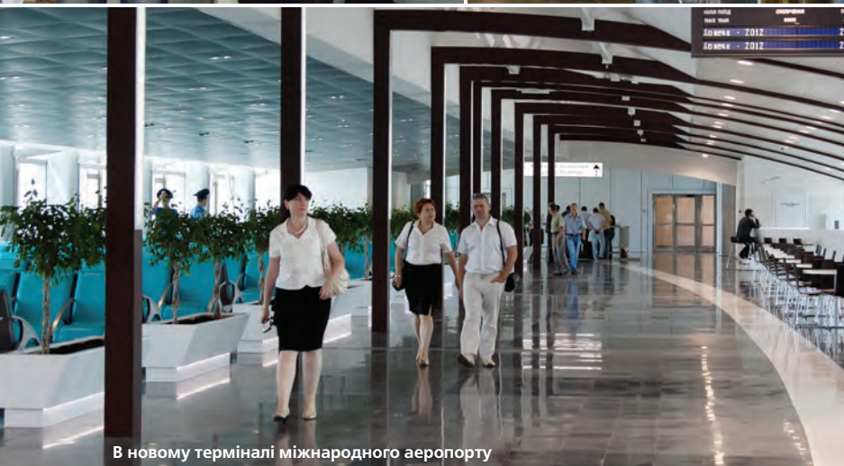
В новому терміналі міжнародного аеропорту

майже в чотири рази. Тепер вокзал приймає до 35 тисяч пасажирів на добу (до реконструкції – 15 тисяч). Потоки подорожніх поділено на тих, хто користується поїздами далекого прямування, та пасажирів приміських потягів. Переходи накріті конкорсами, де облаштовано місця для очікування та кафе. Модернізація вокзалу відбувалася одночасно з модернізацією шляхів: колії подовжили, щоб приймати по два потяги одночасно. Тепер міста, де відбувається Євро-2012, сполучені швидкісним рухом, який обслуговують состави «Hundai Rotem»: зокрема, час перебування в дорозі від Донецька до Києва скоротився майже вдвічі.