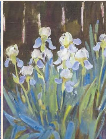
Іриси. 2002 р.