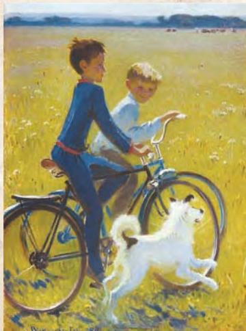
Хлопчики. 1984 р.

Але поки є сили, прагне змалювати все, що лишилося. Для душі. Для пам'яті. Для наступних поколінь. Вона небалакуча за вихованням, що стало другою натурою. Невибаглива, скромна. Були би палітра й фарби, світилися б очі студентів цікавістю... І щоб онуки зростали. На свій імідж і популярність не гаєла дорогого часу. А повагу колег, визнання громадськості здобула виключно талантом, творчістю. І нині, відома, знана, продовжує так жити – в мистецтві й праці.