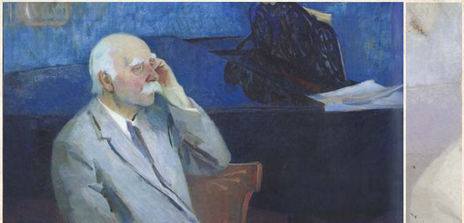
Л. Ревуцький. 1975 р.

Коли німці вдерлися до Києва («Іхали на мотоциклах, як до себе додому», згадає художниця), світ щастя семирічної дівчинки розколовся. Сім'я не встигла евакуюватися. Гестапівці схопили батька на вулиці, по-звірячому катували.