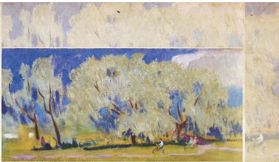
Літо. 2004 р.