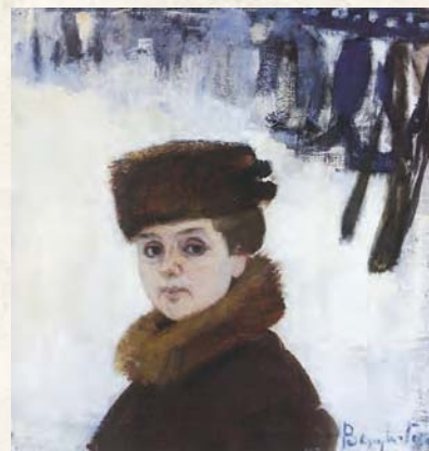
Автопортрет. 1990 р.