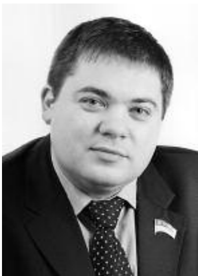
Валерій КАРПУНЦОВ, заслужений юрист України