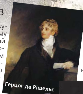
Герцог де Рішельє

Заслуги Стевена з облаштування саду спонукали герцога Рішельє виклопотати 1818 року в імператора Олександра I для працюючого вченого 2000 червінців. Це дало змогу директору здійснити дворічну закордонну подорож задля вивчення й добору плодкових та інших дерев – найпридатніших для засадження ними Нікітського саду. За 12 років невтомної діяльності Христіан Стевен зібрав понад 450 видів екзотичних рослин. Початковий проект передбачав вільне розміщення рослин у поєднанні з галявинами й видовими майданчиками.