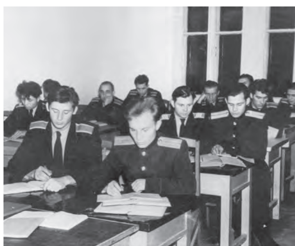
Перші донецькі курсанти. Сумлінність і відповідальне ставлення до навчання – добра традиція Донецького юридичного, яку започаткували саме ці юнаки

Так історично склалося, що найбільш взаємовигідно інститут співпрацює з поліцейськими та науковими колами Баварії (Німеччина). Виховати правоохоронців, котрі матимуть майже цілковиту підтримку серед населення (а саме це характе-