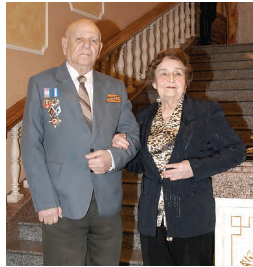
«Золоте» подружжя Фрадкіних

Ми шануємо своє минуле – і саме в цьому вбачаємо неухильний, цілеспрямований рух вперед. І 50 років, які за плечима нашого навчального закладу, – лише початок довгого й упевненого шляху. Шляху до нових звершень.