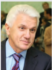
29 жовтня 2012 року Голова Верховної Ради України Володимир ЛИТВИН:

«Вибори відбулися загалом на прийнятному рівні і відповідають ustalеним стандартам, притаманним цій процедурі. Цьому сприяли величезна увага до них, у тому числі з боку міжнародної спільноти, велика конкуренція між учасниками виборчих перегонів та їх взаємний контроль, а також позиція виборців, яка не завжди і не скрізь була передбачуваною для партій та кандидатів. Тим більше, коли порівнювати нинішні вибори з минулими виборчими кампаніями, що мали нюанси, які не в усьому відповідали загальноприйнятним стандартам».