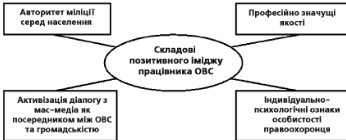
Чинники формування позитивного іміджу міліції

Вагомий внесок у формування нового іміджу міліції вносять українські засоби масової інформації , які дуже часто є єдиним посередником між персоналом ОВС і населенням. Чому? Тому що, по-перше, не кожний пересічний громадянин має потребу звертатися до правоохоронних органів чи стикатися з працівниками різноманітних служб та підрозділів цього відомства. З другого боку, не завжди працівники міліції, передусім «зовнішніх