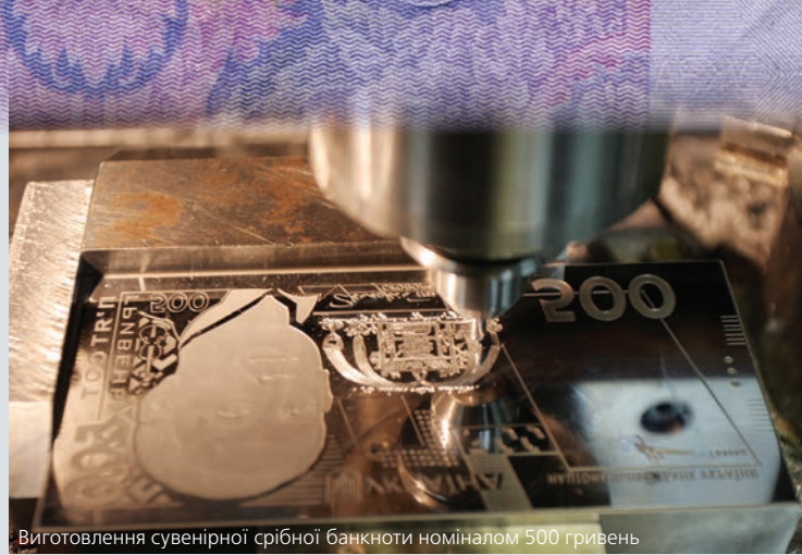
Виготовлення сувенірної срібної банкноти номіналом 500 гривень

2010 року було завершено технічне переоснащення цеху карбування розмінних та обігових монет. Він здатний продукувати до 700 монет за хвилину. Важлива складова – автоматизований комплекс пакування та зберігання монет, який дає змогу ретельно контролювати весь технологічний процес. А йдеться про півтора мільярда штук монет на рік.