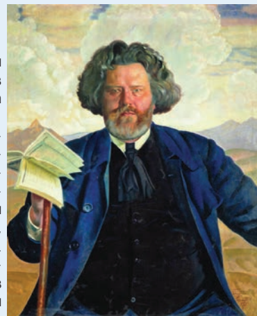
Кустодієв Б. Портрет Волошина. 1924 р.

Останні 10 років Волошин жив у Коктебелі. Помер від запалення легенів 11 серпня 1932 року, похований, як і заповідав, на вершині приморського пагорба Кучук-Янишар.