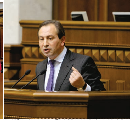
Учасники парламентських слухань