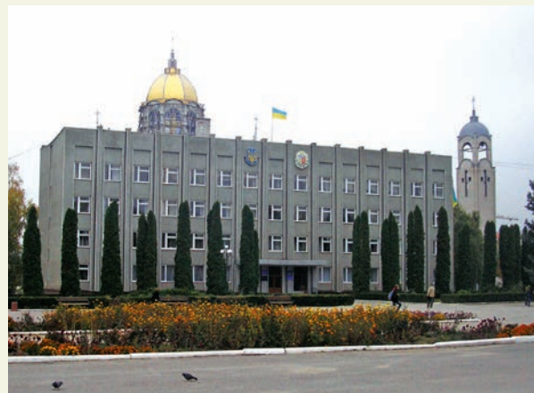
Чортків. Будинок райдержадміністрації

ків. Приватизувавши помешкання, його власники ніяк не можуть стати справжніми господарями, бо не бажать вчитися доглядати за своїм житлом і плекати його. Тому створено вже 75 об'єднань співвласників багатоквартирних будинків. Але змінити психологію людей не так прос-