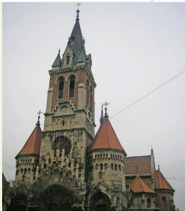
Костел Св. Станіслава. Чортків

– Добування всіляких дозволів у столиці замість того, щоб усе вирішити на місці, є найбільшим гальмом розвитку малого й середнього бізнесу. Основне завдання влади – йти назустріч людям, особливо іні-