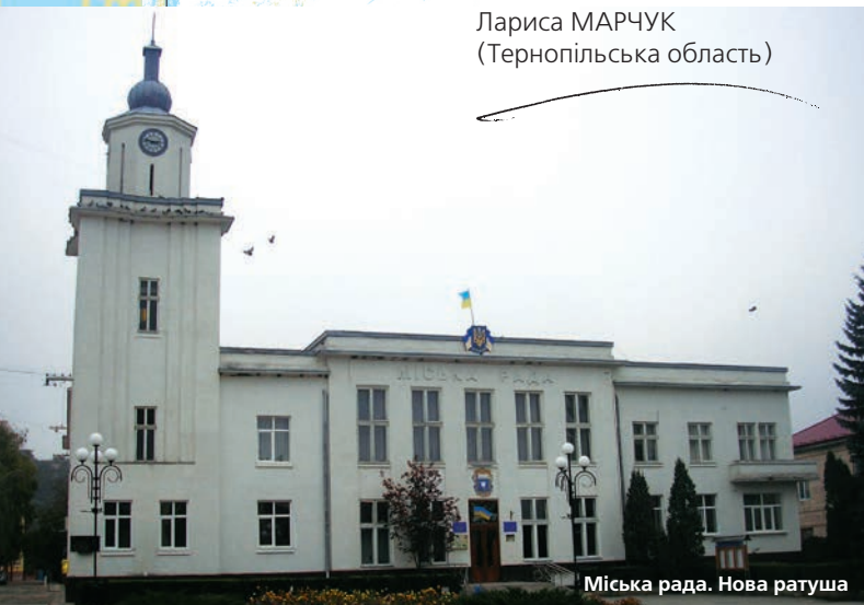
Міська рада. Нова ратуша