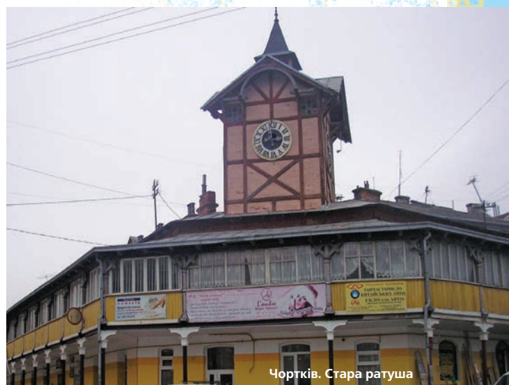
Чортків. Стара ратуша