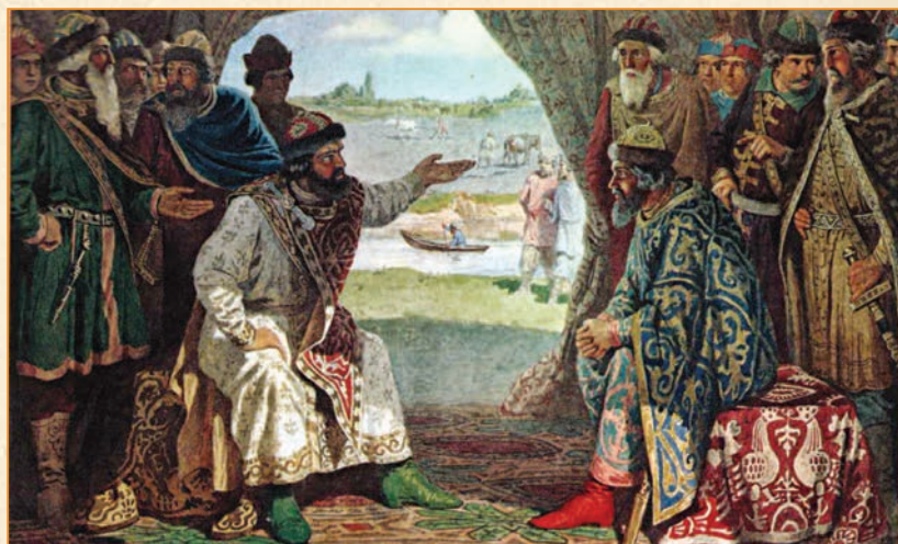
О. Д. Ківшенко. «Долобський з'їзд князів — побачення князя Володимира Мономаха з князем Святополком»

биць. Насправді Володимир, маючи імператорське походження, просто (за велінням душі) дотримався писаних і неписаних правил шляхетного успадкування княжих столів. Саме успадкування, а не захоплення чи завоювання. Так діяв і пізніше, коли довелося поступитися Черніговом і повернутися сорокарічним воїном до Переяслава, який любив і який бачив ще немовлям. Відтоді саме Мономах став першим і єдиним серед князів, хто не програв жодної битви з ворогом. Загалом же він здійснив 83 походи, полонив 300 половецьких ханів і уклав із кочівниками 19 угод.