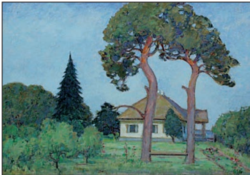
Будинок М. Щербаківського у Шпичинцях