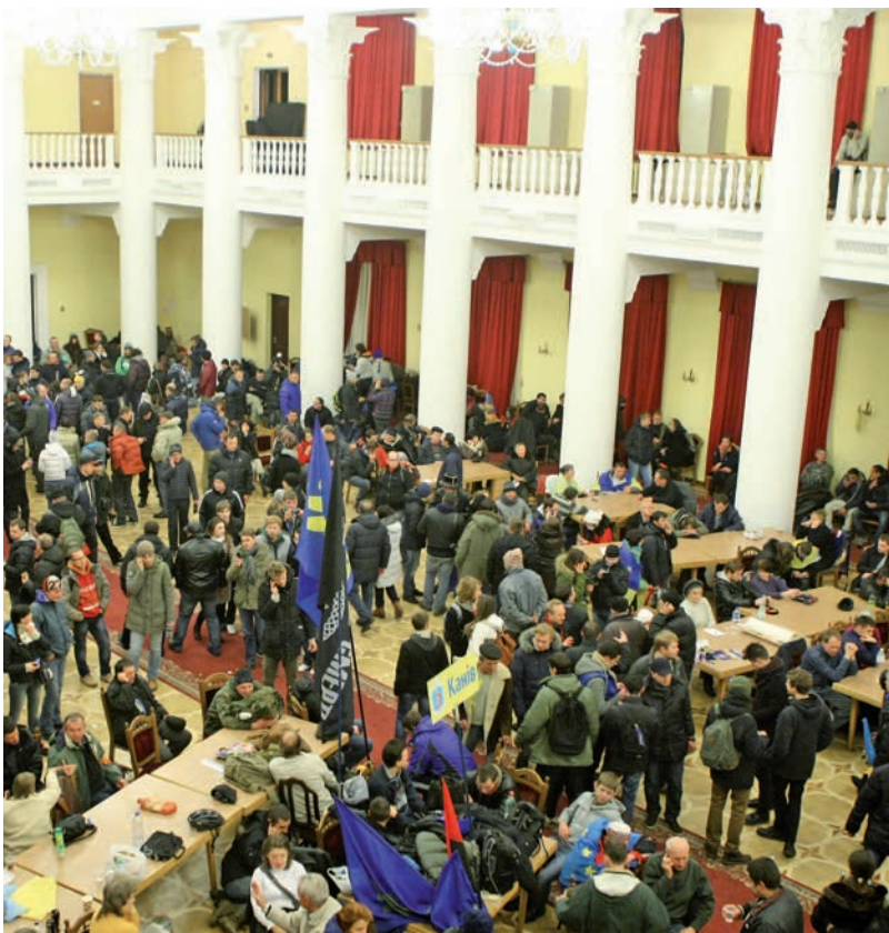
Київ, 1 грудня 2013 року