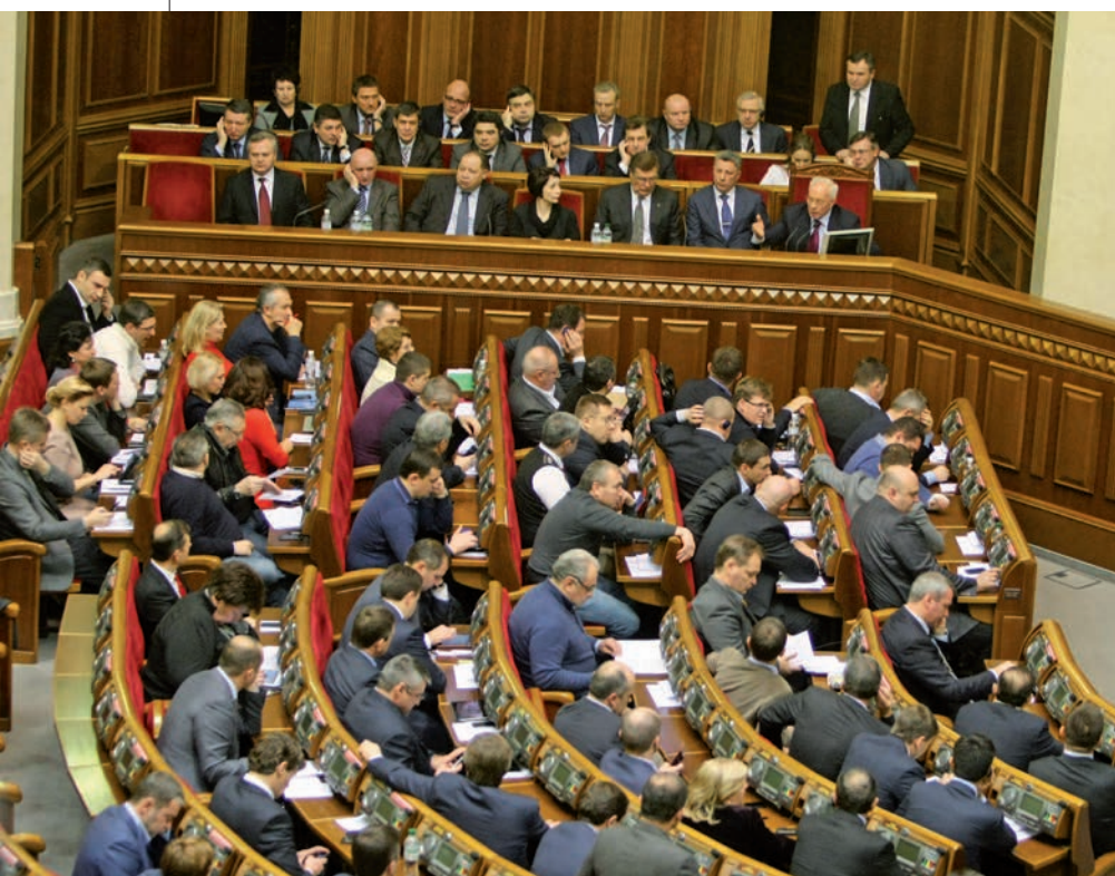
Київ, 3 грудня 2013 року

Під час виступу прем'єр Микола Азаров зазначив, що за наслідками