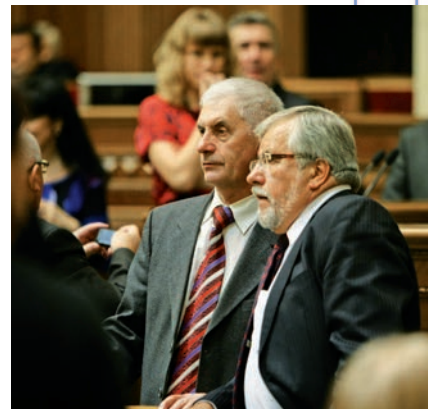
Учасники парламентських слухань