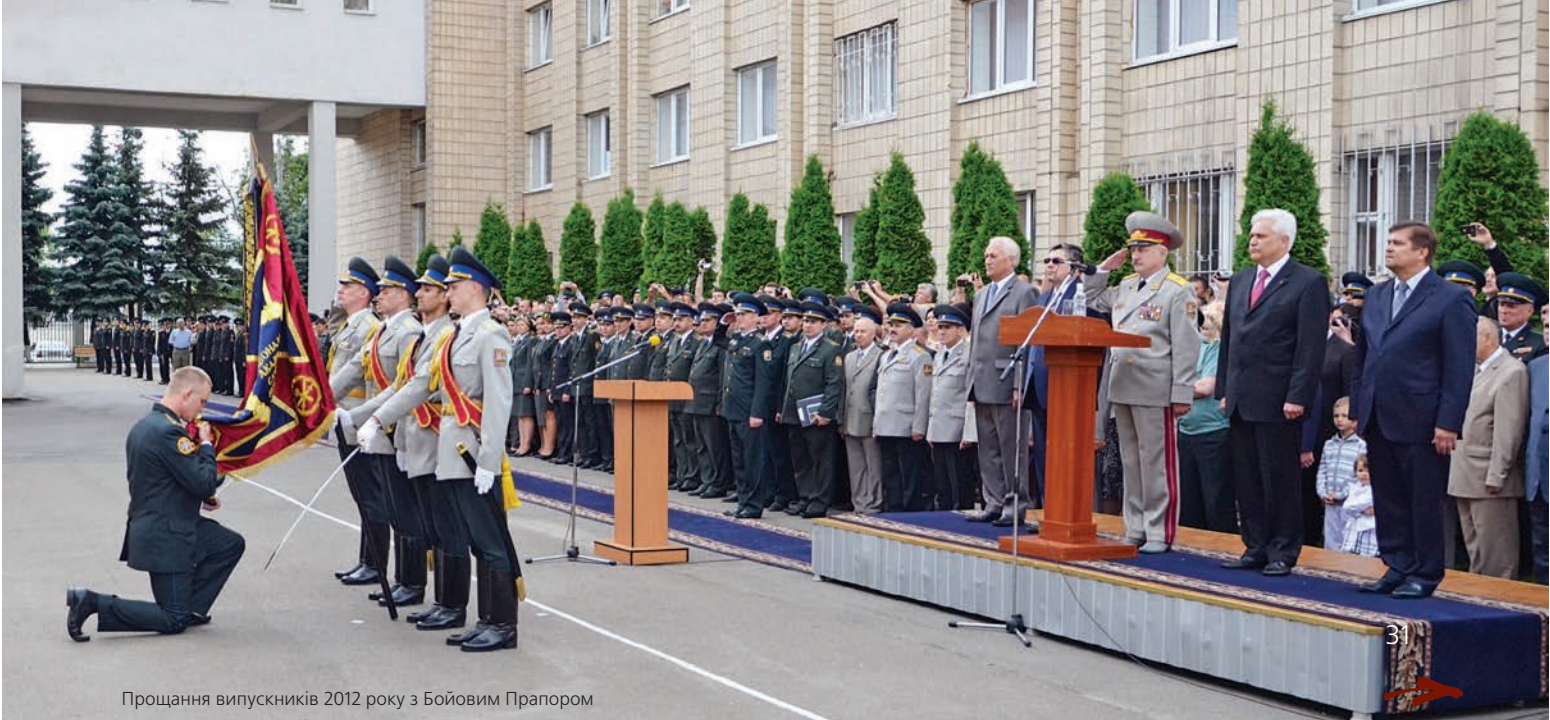
Прощання випускників 2012 року з Бойвим Прапором