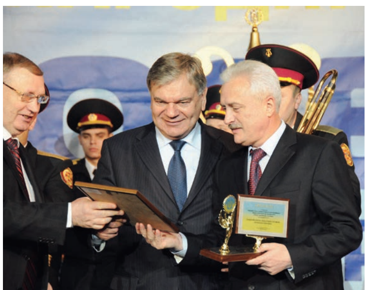
Нагородження Академії Гран-прі за видання підручників нового покоління

патріотичному вихованні – це формування в конкретного курсанта ціннісного ставлення до оточення та самого себе, активної за формою та моральної за змістом життєвої позиції. Тож, починаючи з вересня, протягом навчального року для курсантів, слухачів і студентів проведено 14 зустрічей із видатними особистостями сучасності. Зокрема, в Академії побували ветерани, керівники спецслужби різних років, а також учені – президент Національної академії педагогічних наук України, академік НАН і НАПН України В. Кремень, директор Інституту вищої освіти НАПН України, академік НАПН України В. Луговий, директор Інституту педагогічної освіти і освіти дорослих, академік НАПН України І. Зязюн, майстри художнього слова – лауреати