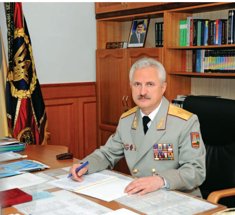
Євген СКУЛИШ, ректор Національної академії Служби безпеки України

Невтомною працею колектив Національної академії Служби безпеки України доводить, що крокує в ногу з часом на всіх напрямках своєї діяльності, відповідає провідним тенденціям розвитку вищої освіти, у нових практичних умовах орієнтується на актуальні вимоги відомства. Освіта української спецслужби впевнено рухається до сучасних стандартів інноваційного розвитку, використовує новітні інформаційні технології, стає динамічнішою, якіснішою, ефективнішою, а курсанти, слухачі та студенти єдиного в державі багатoproфільного спеціального вищого військового навчального закладу контррозвідувального спрямування торують дорогу до вершин професіоналізму. Бездоганна військова служба найуспішніших випускників Академії слугує взірцем для їхніх гідних послідовників серед нинішнього покоління вихованців, спроможних зробити реальний внесок у справу зміцнення державної безпеки України.