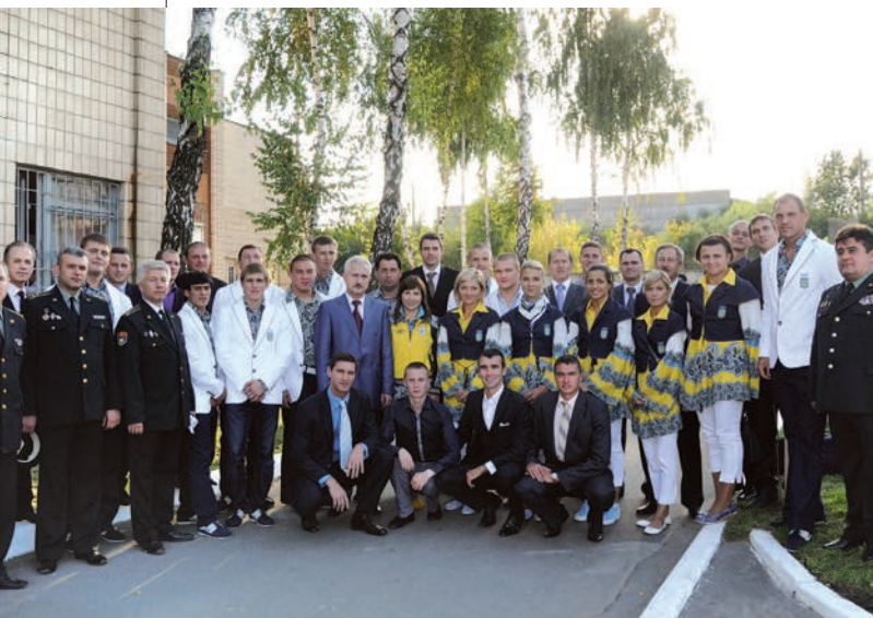
У колективі Академії проходять військову службу та працюють призери й учасники XXX Олімпійських ігор у Лондоні

Потужним рушієм розвитку творчого потенціалу і здібностей змінного складу є інтелектуально-пізнавальний характер виховного процесу. Завдяки активній роботі науково-педагогічного складу кафедр розвиваються багатогранна обдарованість і різнобічні інтереси курсантів і студентів. За два останні роки курсанти здобули три міжнародні премії, майже 30 перемог у всеукраїнських конкурсах, олімпіадах, фестивалях. Головне у професійно-