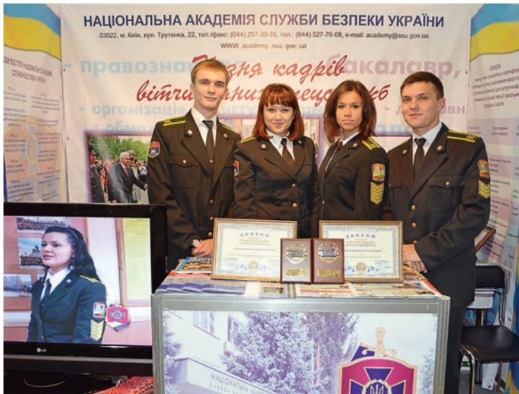
У золотих медалях Національної виставки закладів освіти є частка праці й курсантів Академії

Надано новий поштовх розвитку кадрового потенціалу – головного чинника досягнення вищих цілей у освітній діяльності. Реструктуризовано низку навчально-наукових підрозділів, створено три навчально-наукові інститути, центр мовної підготовки. Розгорнуто діяльність чотирьох нових кафедр. Тільки протягом 2010–2011 років випускники аспірантури, докторантури та здобувачі захистили 9 докторських і 34 кандидатські дисертації, результати яких упроваджено в навчально-виховний процес. Нині 23 випускники аспірантури та докторантури