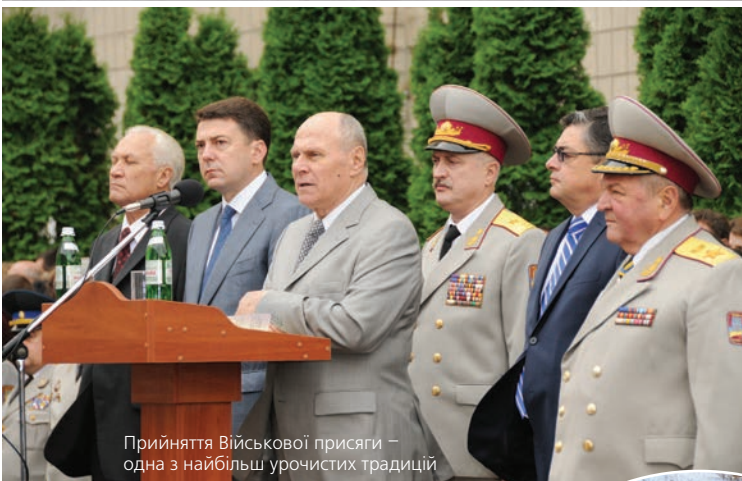
Прийняття Військової присяги – одна з найбільш урочистих традицій