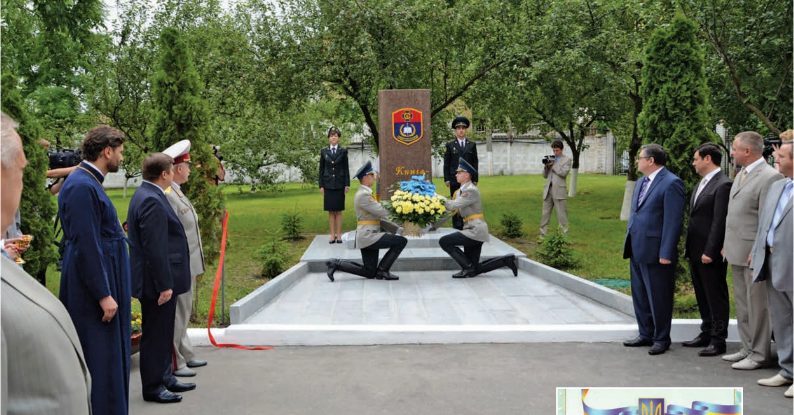
Урочисте відкриття пам'ятного знака «Книга – джерело знань»

мія за два останні роки створила мережу найсучасніших лінгвістичних лабораторій. Комп'ютеризація та спеціалізовані програми в бібліотечно-інформаційній діяльності забезпечили швидке та якісне обслуговування користувачів, змінили на краще весь комплекс бібліотечних послуг. Завдяки матеріально-технічній модернізації здійснено перехід до нової інтерактивної моделі навчання. Важливим стало впровадження новітніх інформаційних технологій для опанування оперативно-тактичних дисциплін на базі комп'ютерного тактичного полігона та