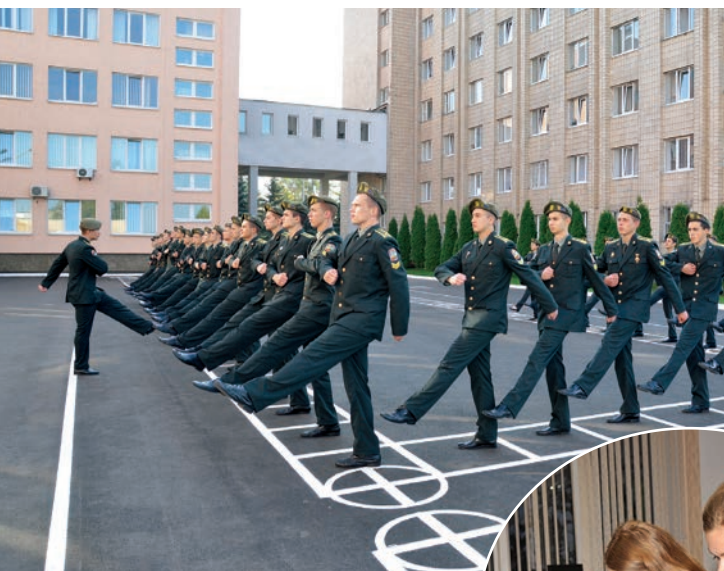
Стройовий вишкіл – основа військової культури

інтерактивного мультимедійного лазерного тиру. Побудовано сучасний європейський багатофункціональний майданчик зі штучним покриттям для спортивних ігор: волейболу, міні-футболу, баскетболу, гандболу та великого тенісу. За сучасними технологіями відновлено зелене покриття футбольного поля стадіону, що є одним із найкращих футбольних газонів у місті Києві. Зроблено й багато іншого для розвитку спортивної матеріальної бази.