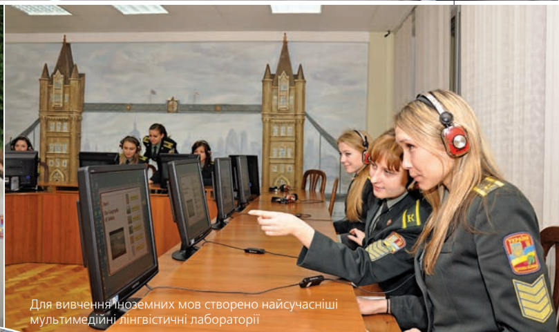
Для вивчення іноземних мов створено найсучасніші мультимедійні лінгвістичні лабораторії

не лише спеціальні вміння і навички, а й потребу постійного самовдосконалення, навчити їх використовувати здобуті знання на практиці та в громадській діяльності. Зусиллями фахового науково-педагогічного складу вдається реалізувати одне з основних завдань Академії – збагачення інтелектуального та духовного потенціалу української спецслужби.