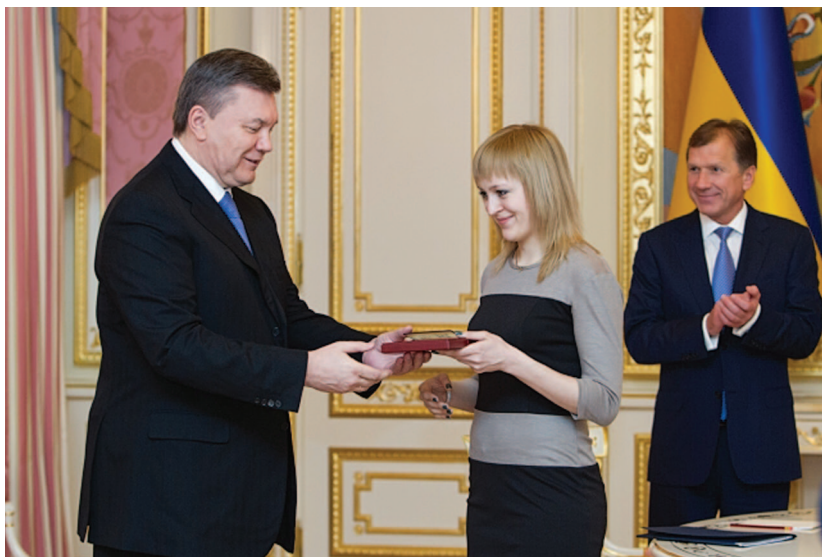
Президент України Віктор Янукович вручає шаховій королеві орден Княгині Ольги II ступеня. Київ, 30 січня 2013 р.

ріанти під суперника, даючи можливість відпочити гравцеві, налаштувати його на боротьбу. Я могла б більше розповісти про користь від тренера, якби він був зі мною в Ханті-Мансійську.