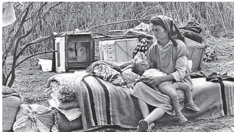
Азербайджанські біженці з району нагірнокарабаського конфлікту, 1993 рік

Що ж до ситуації в Україні, то, як ви пам'ятаєте, після вибухів у Дніпропетровську Президент Віктор Янукович увів у дію рішення Ради національної безпеки та оборони «Про заходи щодо посилення боротьби з тероризмом в Україні». Фахівці РНБО звернули увагу, що підвищення рівня терористичної загрози в Україні стає надзвичайно серйозною проблемою. Серед