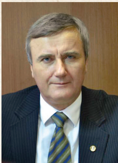
Анатолій ЗАГОРОДНІЙ, віце-президент Національної академії наук України, директор Інституту теоретичної фізики, академік НАН України