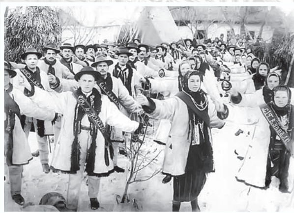
Перше товариство «Січ» при вправах

3. Керівники тіловиховання української молоді мусять чітко уявляти собі, які завдання ставить до українського народу історія. Такими основними завданнями є здобуття незалежності, соборності України, розбудова її господарства і духовної культури, виконання цих завдань вимагає певних властивостей духа і тіла.