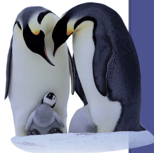
Добірку підготували Юлія ЦИРФА та Ольга КЛЕЙМЕНОВА.

Призначаючи 2014-й роком поєднання роботи і сім'ї, Європейський парламент обрав його символом красивого й мудрого пінгвіна. Ініціатори такого змістового забарвлення року отримали «добро» від Євросоюзу та спланували безліч корисних заходів в ім'я гендерної справедливості.