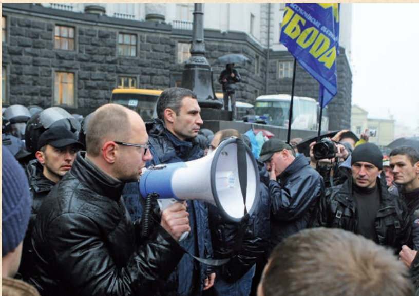
Лідери фракції ВО «Батьківщина» Арсеній Яценюк, УДАРУ – Віталій Кличко, а також представники ВО «Свобода» під час акції біля Кабінету Міністрів на підтримку підписання Угоди про асоціацію України з ЄС. Київ. 25 листопада 2013 року

Ці набуті чужі цінності й установки з часом дедалі більше блокували, деформували і відтисняли на другий план компоненти власне української ментальності – первинні компоненти української ідентичності. Відповідно, в різних регіонах сформувалося й неоднакове ставлення мешканців до проблем ужитку української мови, незалежності України, шляху її подальшого розвитку та інших принципових загальнонаціональних питань. Проте функціонування українського соціуму в межах малих суспільних груп ніколи не применшувало значення ключової риси окремої особистості – її індивідуалізму, який, забезпечуючи насамперед форму і спосіб утвердження людини в соціумі, завжди сприяв реалізації демократичних ідеалів українства – прагнення до рівноправ'я, народного волевиявлення і демократії. Зміна характеру прояву цих цінностей, котрі за відсутності існування української державності дістали підтрим-