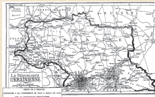
Карта України, представлена делегацією УНР під час ведення переговорів на Паризькій мирній конференції

Хоча, беручи до уваги суто геополітичний чинник, можна стверджувати, що саме такий варіант регіональної співпраці виявився основною віхою в розвитку зовнішньополітичного курсу нашої держави і нині. Адже ні відстоювані ініціативи мирного врегулювання конфліктів на європейському терені, ні можливості розвитку туристичного сектору чи жодні інші міжнародні пріоритети не можуть уплинути на процес стабілізації внутрішньополітичної ситуації в Україні, сприяти налагодженню діалогу між керівництвом держави