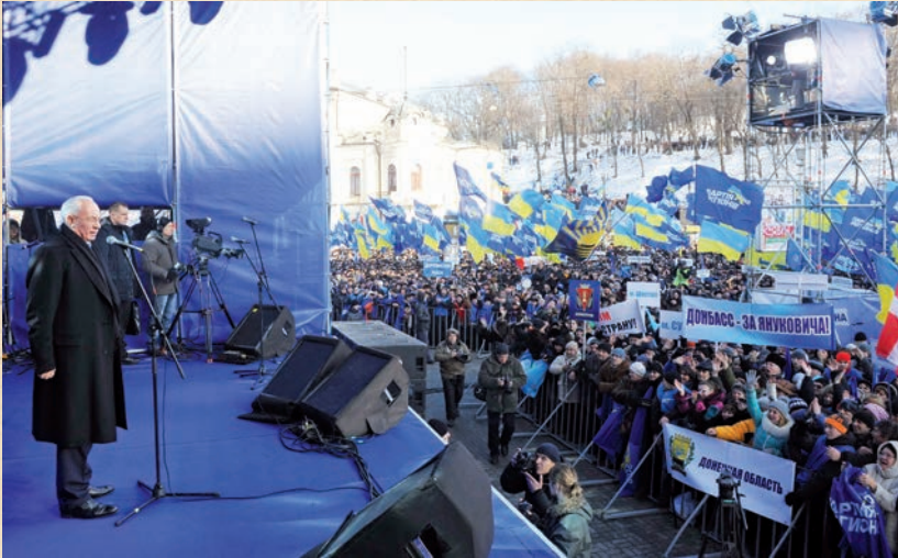
Прем'єр-міністр України Микола Азаров виступає перед учасниками всеукраїнської акції на підтримку курсу Президента України «Збережемо Україну» на Європейській площі в центрі столиці. Київ, 14 грудня 2013 року

ку в рамках малих суспільних груп, не змінила їхньої справжньої, європейської суті. Натомість суспільне будівництво на Сході завжди потребувало лідера, вождя чи диктатора. Відтак, отримуючи найменшу можливість для становлення власної держави як ключового механізму виявлення та підтримки інтересів українського соціуму на міжнародній арені, представники української нації яскраво виявляли глибинні риси власного менталітету, намага-