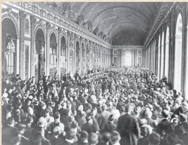
Паризька мирна конференція, скликана по завершенні Першої світової війни (18 січня 1919 – 21 січня 1920 рр.)

Фактично вже вкотре протягом усієї історії розвитку української держави перед її керівництвом постало питання вибору: геополітичного, стратегічного, економічного та, що найголовніше, цивілізаційного. Цього разу на порядку денному не просто політичні рішення, прийняття яких має спиратися на сухі фінансово-статистичні показники чи доцільність державного розвитку. Їхній зміст та ухвалення торкнулися усього громадянського суспільства, котре вже зробило власний соціокультурний вибір, виявивши споконвічні риси українства та, як наслідок, його історичні та геополітичні пріоритети.