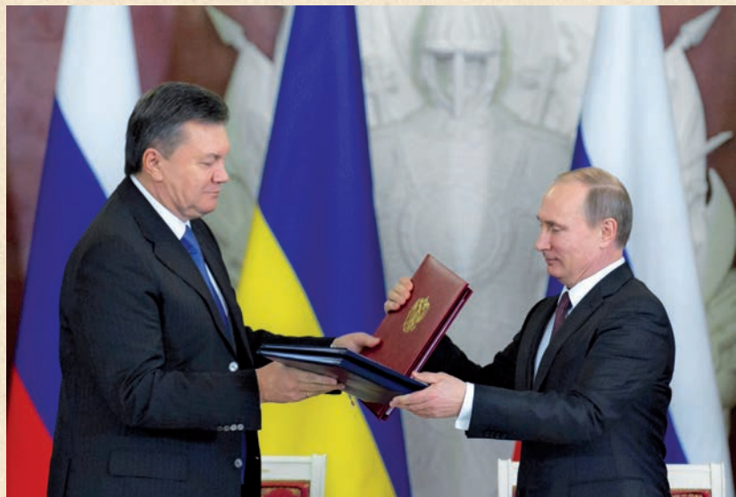
Президент України Віктор Янукович та Президент Російської Федерації Володимир Путін на церемонії підписання двосторонніх документів. Москва, 17 грудня 2013 року

Зважаючи на те, що на Росію припадає близько 32% загальних обсягів зовнішньоторговельного обігу України (в середньому 45–50 млрд. дол. США на рік), а міжнародне рейтингове агентство Fitch Ratings ще 8 листопада 2013 року знизило суверенний довгостроковий рейтинг України до рівня B- (підтвердивши переддефолтний стан української економіки 18 грудня), втрача