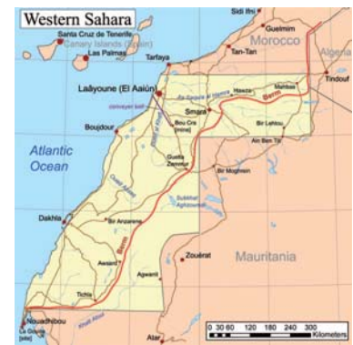
Західна Сахара. Червоною лінією показано «Марокканську стіну»

Надалі в Західній Сахарі продовжували діяти дві політичні й військові сили – марокканська армія та створений 1973 року фронт ПОЛІСАРІО, який адвокував проведення референдуму щодо самовиз-