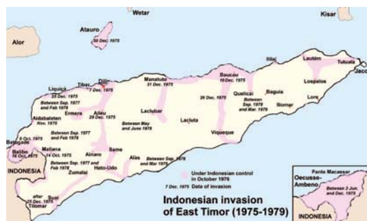
Перебіг індонезійського вторгнення до Тимору

Опір індонезійської влади залишався досить сильним, однак референдум 1999 року, покликаний визначити майбутнє Східного Тимору, довів, що більшість населення острова виступає за незалежність, і 20 травня 2002 року він став суверенною державою. 27 вересня того самого року Східний Тимор приєднався до ООН, ставши 191-м членом цієї організації.