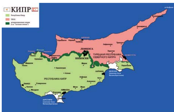
Мапа Кіпру після поділу на грецьку та турецьку частини

Включивши до Кіпрської конвенції статтю, котра зобов'язувала султана провести необхідні англійському уряду економічні й соціальні реформи, Велика Британія взяла на себе роль керма-