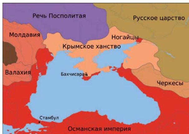
Політична карта Причорномор'я в 1600 році

Як наслідок 1 (12) листопада 1772 року в Карасубазарі було підписано