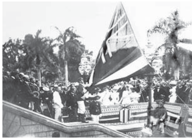
Над палацом Іолані 12 серпня 1898 року було спущено прапор Гавайської республіки й піднято прапор Сполучених Штатів Америки

До речі, дуже часто вважається, що свого часу Техас також був анексований США задля розширення своєї території на південь.