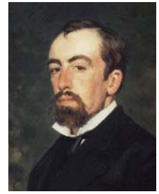
Портрет Поленова (автор – І. Рєпін)