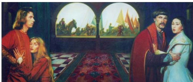
Європа молода. Спаси і збережи

У мене фактично якогось Рубікону перед вибором подальшого шляху не було: куди йти після школи? Все яюсь уже вирішилося само собою. І я поїхав учитися в художнє училище, п'ять років там відучився і думав учитися далі. Але мій учитель Шеховцов відсоветував мене: ну, навіщо тобі знову вчитися того, що ти вже вмієш? Давай вдосконалюйся, пиши картини, шліфуй, в тебе це добре виходить.