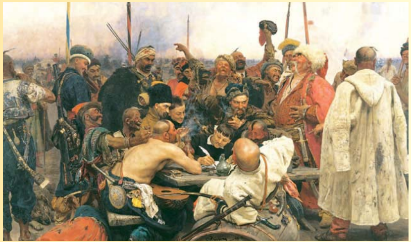
«Запорожці пишуть листа турецькому султану»

Сказати, що він був закоханий в Україну, – отже, не сказати нічого. Чи то давалося взнаки козацьке коріння, чи то земля слобожанська заворожила майбутнього художника ще за народження, але батьківщина притягувала його до себе магнітом упродовж всього життя. Й до фінального свого дня Рєпін був відданий українським сюжетам та образам: останньою в його величезному творчому доробку стала незавершена картина «Гопак».