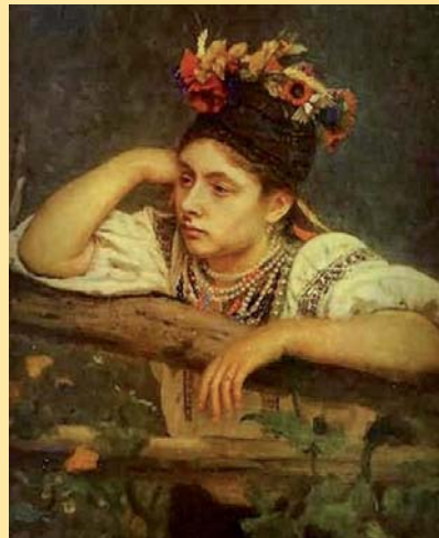
«Українка біля тину»

Особливу главу творчості майстра формують творіння із шевченківської тематики. Ілля Юхимович вважав Та-