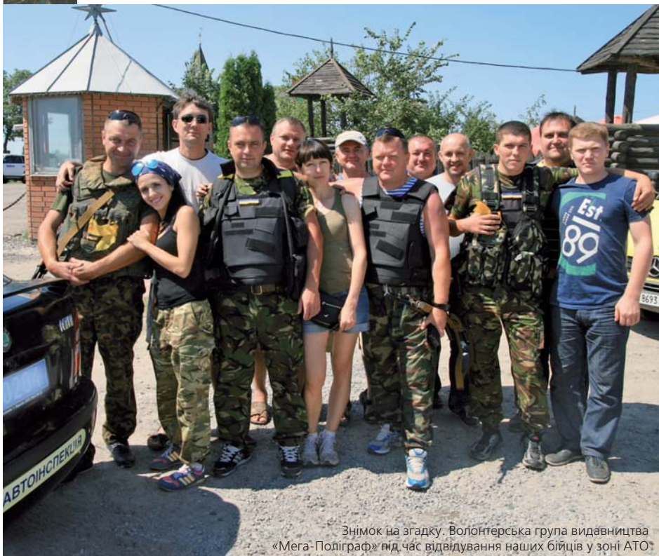
Знімок на згадку. Волонтерська група видавництва «Мега-Поліграф» під час відвідування наших бійців у зоні АТО