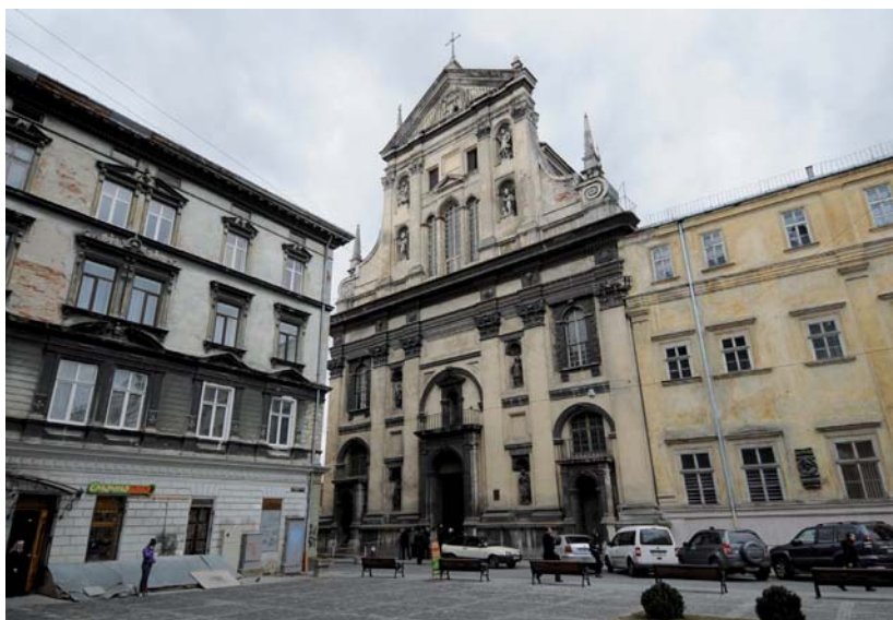
Храм Петра і Павла

Попри оптимістичний прогноз, Юрій Лукомський має свій погляд на розвиток археології в місті. Біз-