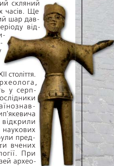
Готична фігурка чоловіка. XV ст.

У день археолога, який святкують у серпні, львівські дослідники Інституту українознавства імені І. Крип'якевича НАН України відкрили виставку своїх наукових здобутків, де були представлені роботи вчених відділу археології. При інституті діє музей археології, де експонується чимало артефактів княжого періоду Львова.