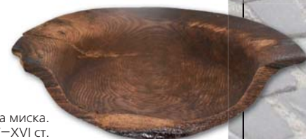
Дерев'яна миска. XV–XVI ст.