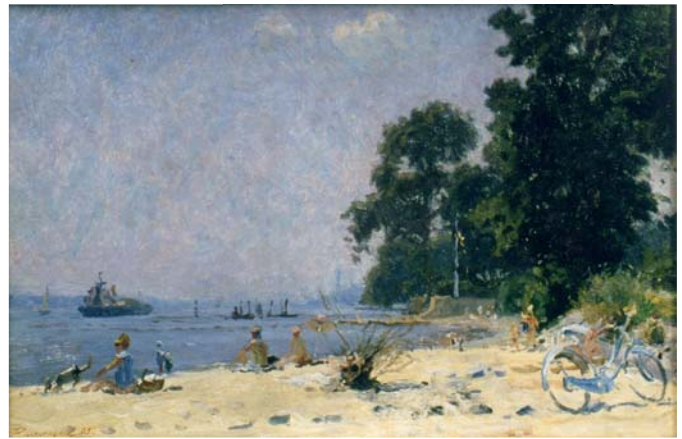
Віктор Романщак. «Пляж на Ельбі. Гамбург». 1995

Експоновані твори беззвучно ведуть мову про три індивідуальні характери, три особливі долі. Зрештою, образотворчість не є ілюстрацією до життя. Це – життя, яким живе художник.