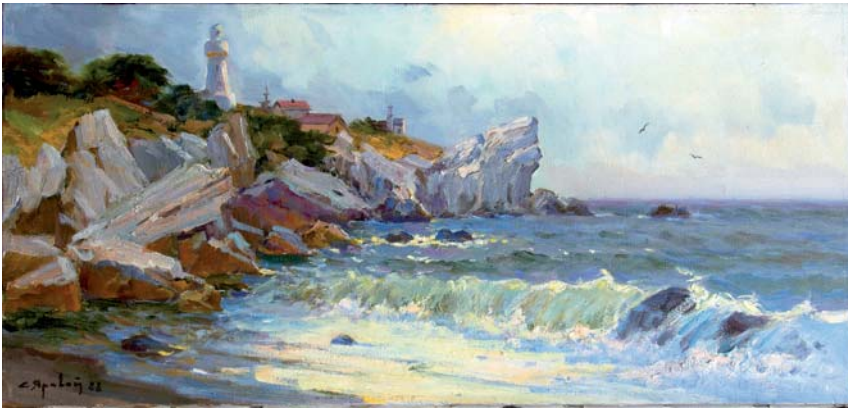
Степан Яровий. «Маяк на місі Сарич». 1988