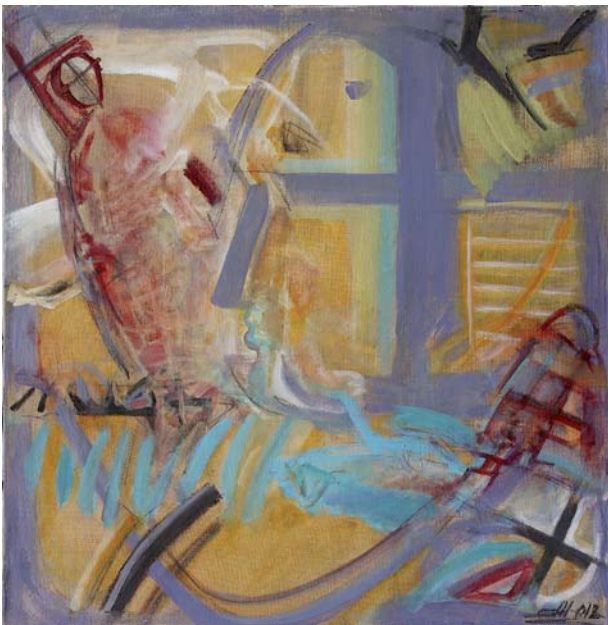
Наталія Ярова. «Жовте вікно. Фрагменти». 2013