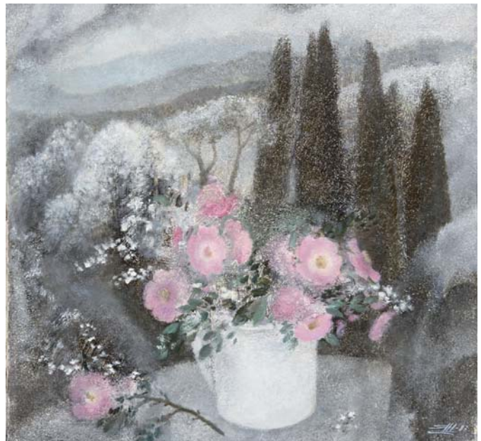
Наталія Ярова. «Туманний день». 1987