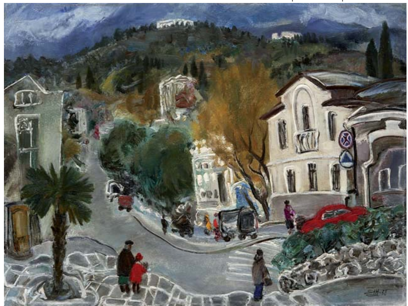
Наталія Ярова. «Осін у Ялті». 1988