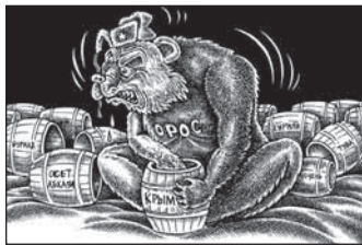
Автор Трогбайяр САМАНДАРІ (Монголія)