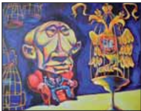
Автор В'ячеслав КАЗАНЕВСЬКИЙ (Україна)