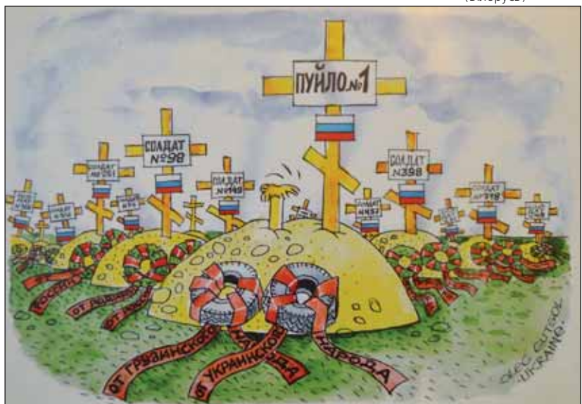
Автор Олег ГУЦОЛ (Білорусь)