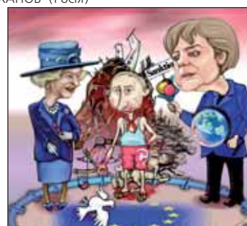
Автор Дмитро ФУРМАН (Німеччина)