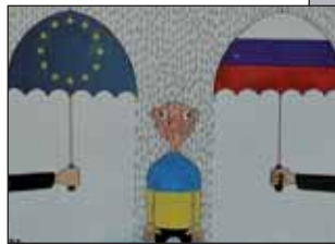
Автор Д. ПОЛЬ (Австралія)