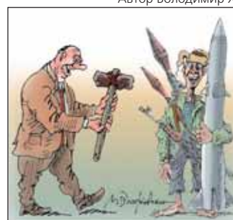
Автор Михайло ЗЛАТКОВСЬКИЙ (Росія)