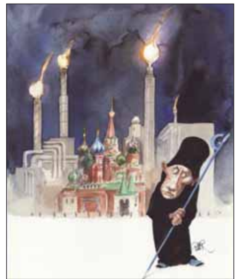
Автор Рібер ХАНССОН (Швеція)