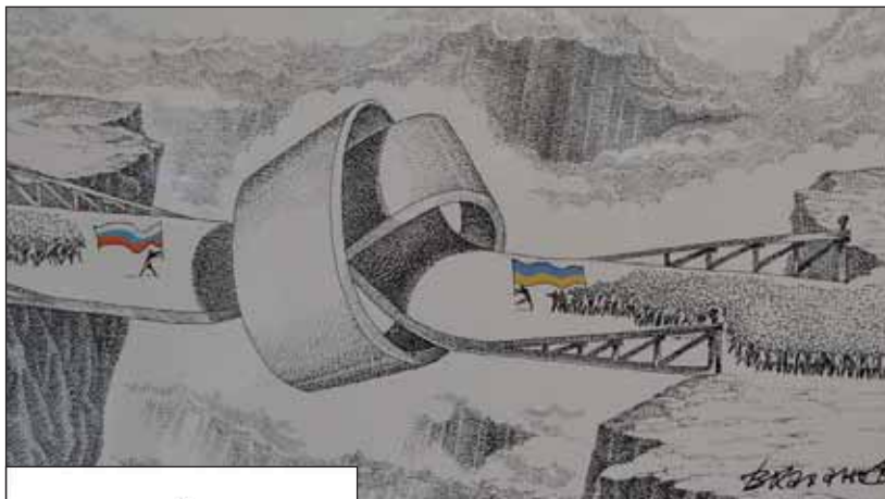
Автор Володимир ХАХАНОВ (Росія)