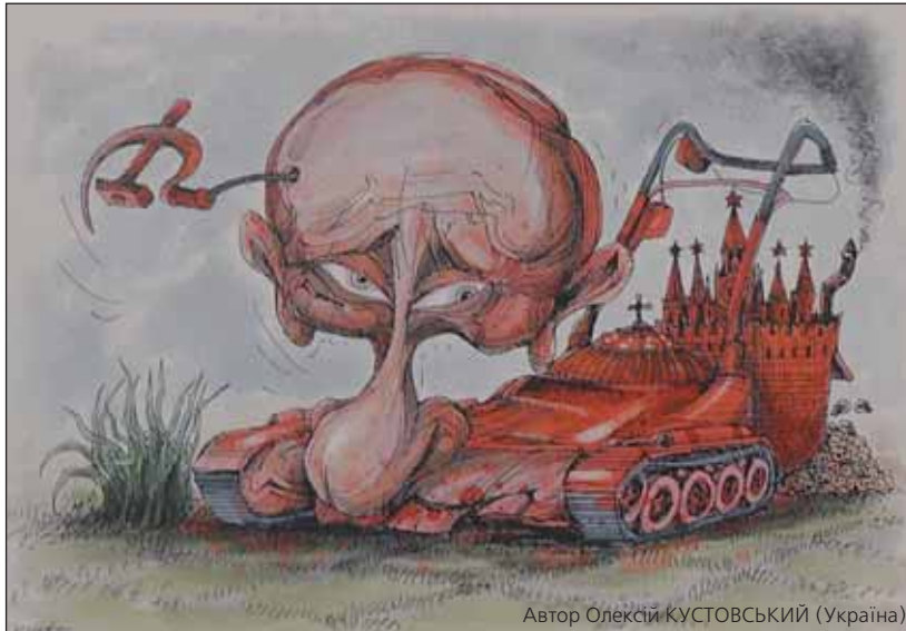
Автор Олексій КУСТОВСЬКИЙ (Україна)