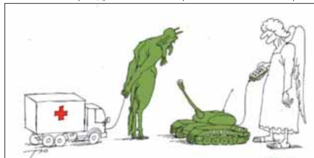
Автор Сергій ТЮНІН (Росія)