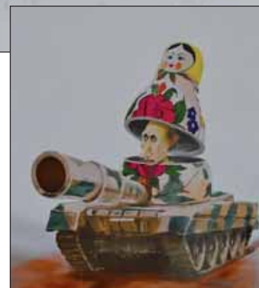
Автор Рібер ХАНССОН (Швеція)