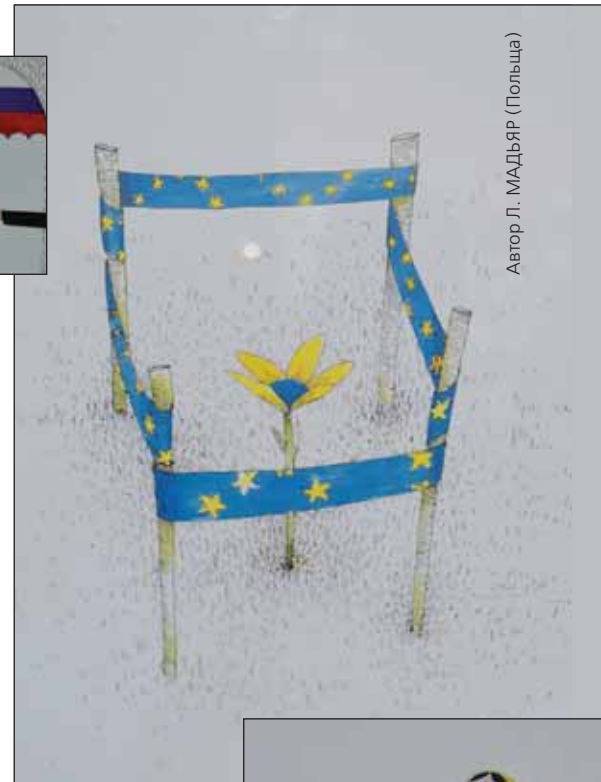
Автор Л. МАДЬЯР (Польща)