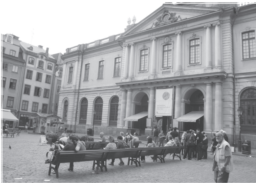
Музей Альфреда Нобеля

Не можна не виокремити ще одну атрибутивну рису-якість романістики Патріка Модіано. Це його незмінне внутрішнє несприйняття нацизму як способу мислення й стилю життєповедінки. Цим несприйняттям озвучені його перші романи – «Площа Зірки», «Нічна варта» (« La Ronde de nuit », 1969), «Бувварне кільце», воно пробивається-проривається й у таких пізніших текстах, як «Сімейна хроніка» (« Livret de famille », 1977) і «Пом'якшення виroku». В останньому вустах одного з персонажів дається недвозначно різка й категорична оцінка тим фігурантам цього роману, хто «від великих афер на чорному ринку» дійшов «до співпраці з німецькою поліцією». У цьому контексті стають цілком зрозумілими смислові відтинки формулювання Нобелівського комітету, згідно з яким головний літературний приз року дістався Патріку Модіано: «За мистецтво пам'яті, завдяки якому він виявив найнезбагненніші людські долі й розкрив життєвий світ людини часів окупації».