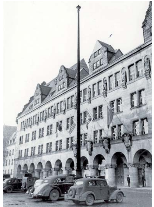
Палац юстиції, де відбувався Нюрнберзький процес

Юрисдикція Суду не має ретроактивного характеру. Він може розглядати злочини, вчинені виключно після набрання чинності Статутом та створення самого Суду, тобто після 1 лип-