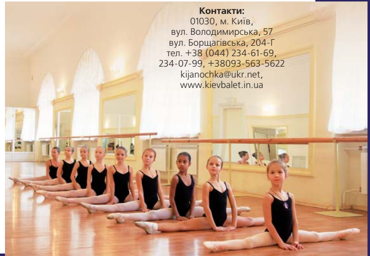
Учениці хореографічної гімназії «Кияночка»

Контакти: 01030, м. Київ, вул. Володимирська, 57 вул. Борщагівська, 204-Г тел. +38 (044) 234-61-69, 234-07-99, +38093-563-5622 kijanochka@ukr.net, www.kievbalet.in.ua