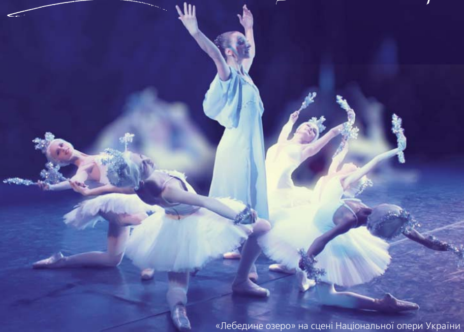
«Лебедине озеро» на сцені Національної опери України