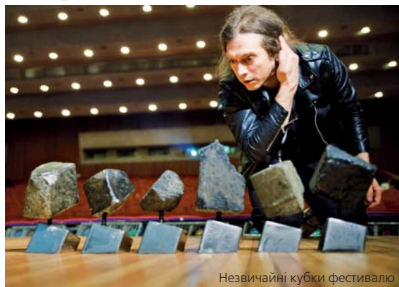
Незвичайні кубки фестивалю