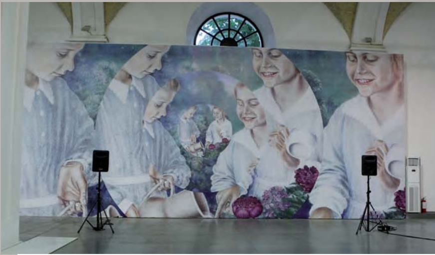
За мотивами «Портрету племінниць художниці»