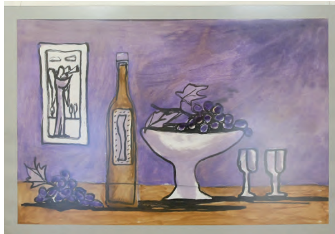
Марта Базак. «Фіолетовий натюрморт»