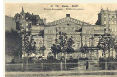
Будівля театру «Соловцов» на початку XX століття

Театр розпочав свою діяльність 1920 року у Вінниці. А 1926-го оселився за своєю сучасною столичною адресою – в колишньому приміщенні театру Соловцова, спроектованому понад 100 років тому Е. Брадтманом та Г. Шлейфером.