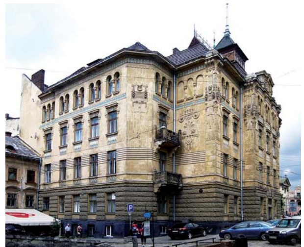
Будівля Національного лісотехнічного університету (Львів). Архітектор Іван Левинський

ковими будинками визначала обличчя таких центрально-європейських столиць, як Берлін, Відень, Варшава і Львів.