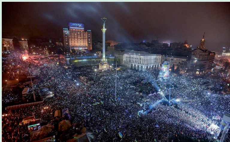
У новорічну ніч 2013—2014 тисячі українців на майдані Незалежності у Києві виконали національний гімн