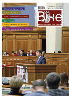
Голова Верховної Ради України Володимир Гройсман звітує про підсумки першого року діяльності парламенту восьмого скликання. Київ, 27 листопада 2015 року