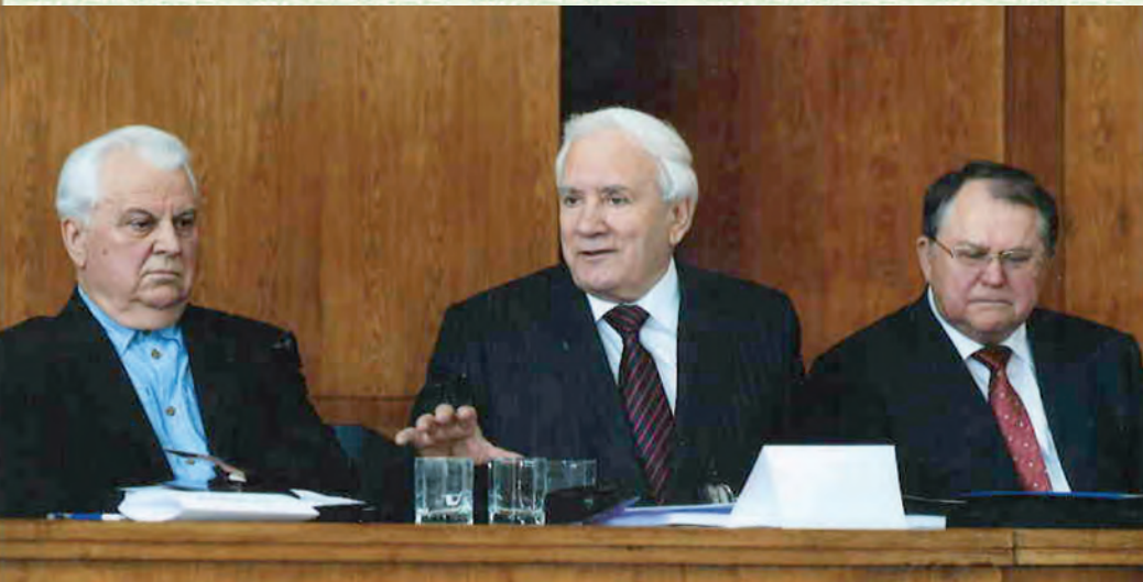
Ю. С. Шемшученко веде міжнародну наукову конференцію, присвячену 65-річчю Інституту держави і права ім. В. М. Корецького НАН України. Поруч перший Президент України Л. М. Кравчук та голова Конституційного Суду України Ю. В. Баулін

опрацювання на цій основі пропозицій і рекомендацій, спрямованих на наукове обґрунтування реформування правової системи України. Саме на це й націлені зусилля колективу. Щороку ми надсилаємо до відповідних державних органів сотні пропозицій і рекомендацій та експертних висновків, публікуємо 10–15 монографічних праць, проводимо національні й міжнародні наукові конференції, круглі столи, семінари тощо.