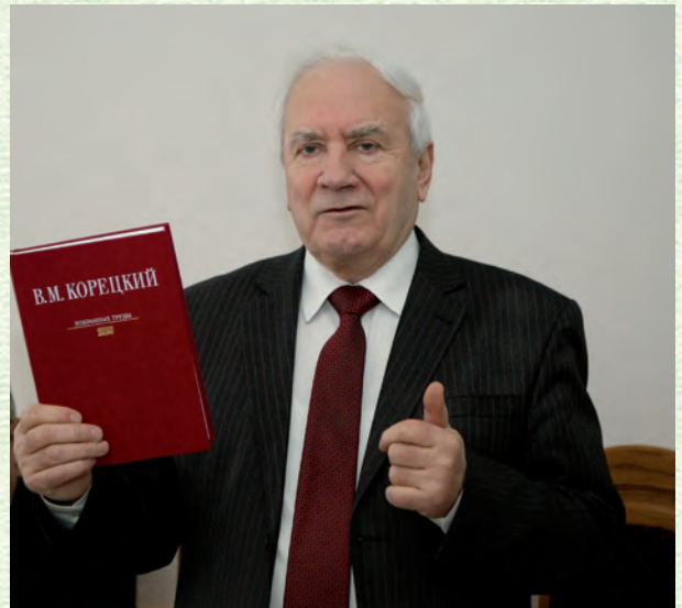
Круглий стіл в Інституті держави і права «Регіональна політика і децентралізація влади в Україні»

Бесіду вела Світлана ПИЛИПЕНКО, Фото Миколи БІЛОКОПИТОВА та з архіву Ю. С. Шемшученка.