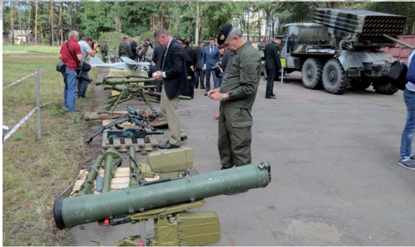
Закрита виставка трофеїв із зони АТО (організована силовиками в серпні 2014 року спеціально для військових аташе іноземних держав)

Переговори, що відбулися 11 лютого в Мінську в «нормандському форматі», не варто переоцінювати. Рука Москви на них нічого не підписувала. Більше того, намагатиметься використовувати їх для поповнення угруповання живою силою й технікою, щоб рано чи пізно зірвати перемир'я й відновити війну. Перший «транш» поповнення до бойовиків прийшов уже 12 лютого. Щоправда, на переговорах європейці показали, що не бояться руки. А разом і не вірять. І що кремлівський винахід – фейкові утворення «ДНР» і «ЛНР» – ніхто, крім призначених самих Кремлем лідерів колишніх авто-