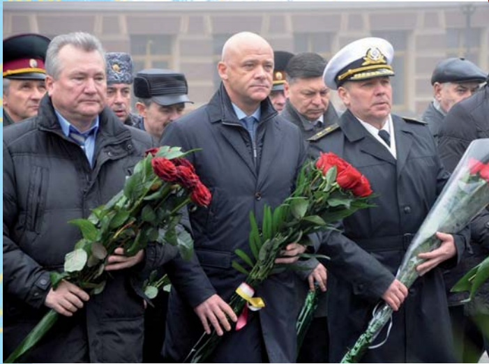
Під час святкування Дня соборності (зліва – направо) заступник голови - керівник апарату обласної державної адміністрації Володимир Кулаков, міський голова Одеси Геннадій Труханов, командувач ВМС Збройних Сил України контр-адмірал Сергій Гайдук

спецтехніка просто не могла працювати. Вона стояла в заторах. Трохи згодом, у нічний час, нам вдалося нормалізувати становище.