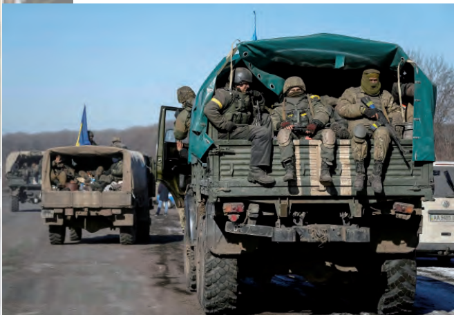
Вихід із Дебальцевого