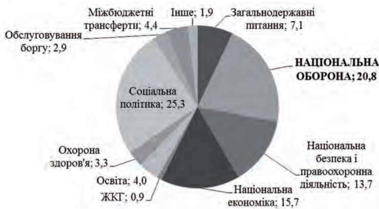
Рис. 2. Структура видатків федерального бюджету РФ у 2015 році, %

ну 2016-го. За оцінками фахівців, бюджет РФ упродовж 2015 року доведеться переглядати.