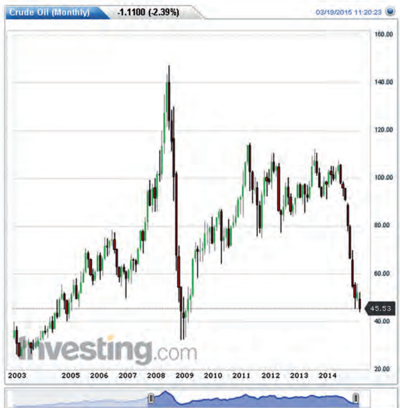
Рис. 1. Динаміка цін на сирину нафту на світовому ринку в 2003–2015 роках, дол. США за барель

– послаблення євро у зв'язку із започаткуванням Європейським центральним банком програми кількісного пом'якшення на суму