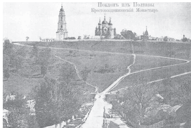
Поклоніть ізъ Полтавы Крестовоздвиженскій Монастырь