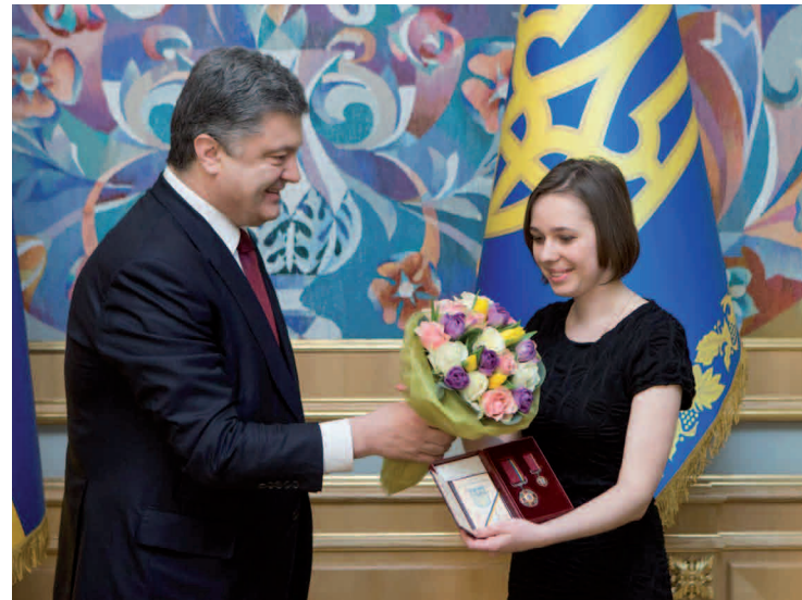
Президент України Петро Порошенко в 2015 році пообіцяв Марії Музичук допомоги з організацією матчу із захисту титулу на батьківщині – у Львові або Києві

дерації шахів України Віктором Капустіним, деякі масмедіа намагалися знайти тут політичний підтекст з подачі 13-го чемпіона світу з шахів Гаррі Каспарова. Той назвав Ілюмжинова «людиною Кремля», а рішення президента Федерації шахів України щодо проведення матчу в Україні «не надто плідною дебютною ідеєю».