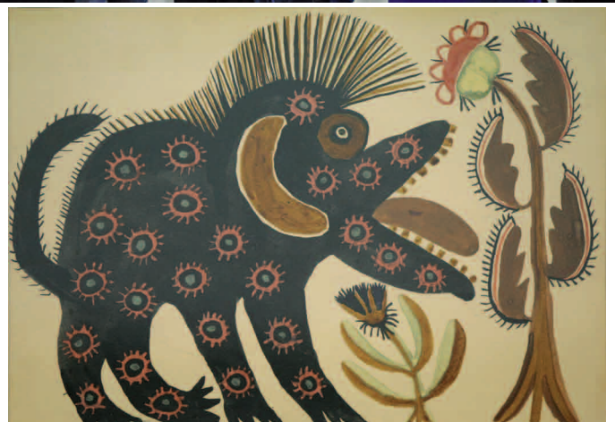
«Чорний звір». 1936 рік