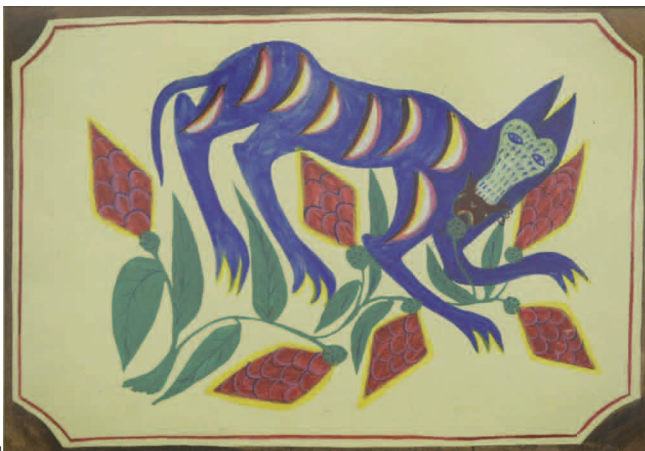
«Фантастичний звір». 1937 рік