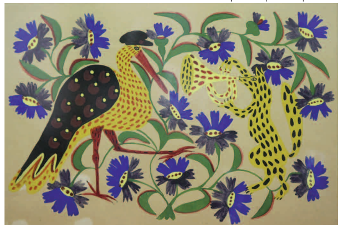
«Лисиця та журавель». 1937 рік