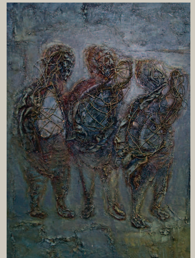
Серія «Гербарій почуттів». 1990 рік