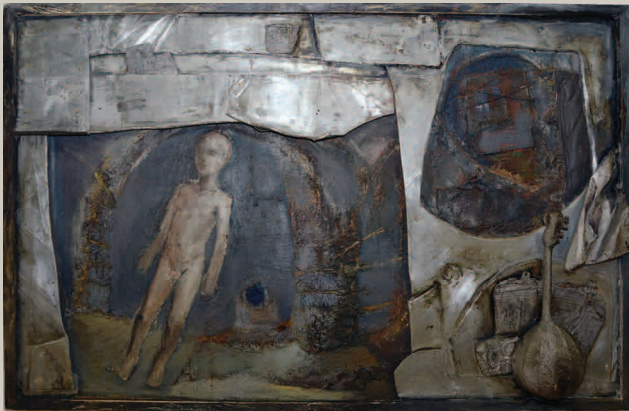
Серія «Гербарій почуттів». 1995 рік