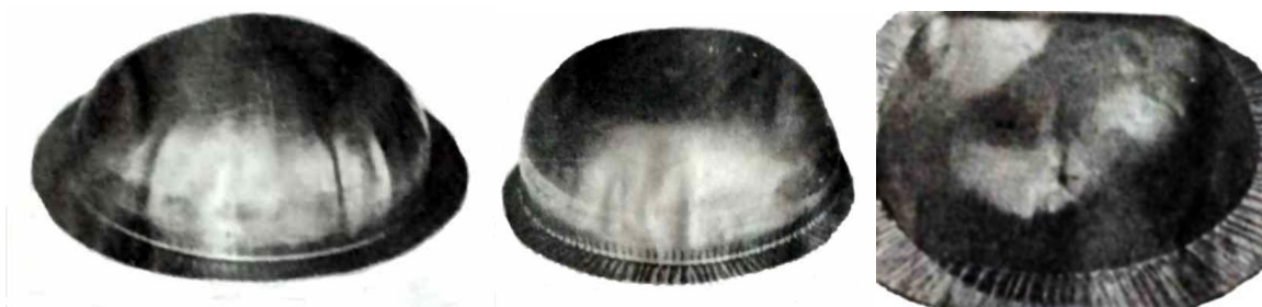
Рис. 1. Отштампованные тонколистовые детали с различными типами потери устойчивости при пневмоударной штамповке жидкостью

Листовая заготовка малой толщины при вытяжке может получить следующие типы потери устойчивости: волнистость (образование складок), неравномерность вытяжки фланца, наличие вмятин на купольной части и сосредоточенное утонение (рис. 1.)