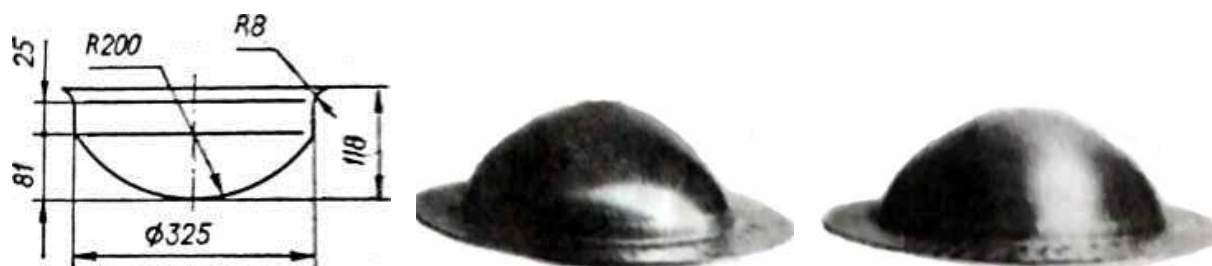
Рис. 3. Цилиндрическая деталь со сферическим днищем

Вытяжка с плоским прижимом на пневмоударной установке Т-1324 позволяет использовать заготовки без потери устойчивости с меньшей относительной толщиной, чем в штампе. Так, за одну операцию без специальных конструктивных мероприятий и промежуточных отжигов вытягивалась деталь «полусфера» (рис. 3) при коэффициенте вытяжки k = 1,69 и относительной толщине заготовки 0,42 %, что в 3 раза меньше расчетной – при вытяжке пуансоном по зависимости (1) и в 1,1–1,2 раза меньше предельной – при вытяжке с большим усилием прижима.