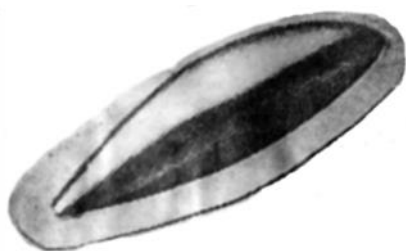
Рис. 5. Внешний вид детали типа «обтекатель»

Учитывая, что условия устойчивости заготовки при формовке осесимметричных элементов несферической формы примерно подобны условиям устойчивости заготовки при формовке сферических элементов, полученные результаты можно распространить и на вытяжку эллиптических, неглубоких конических и других близких к ним по форме деталей (рис. 5).